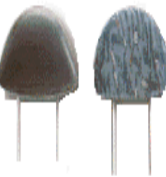
자동차 Head Rest